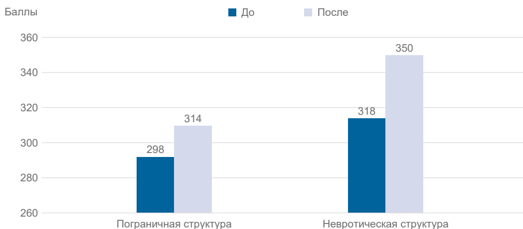
Рисунок 1. Баллы по подшкалам Шкалы психологического благополучия Рифф у пациентов до и после психотерапии по сравнению с контрольной группой

Рисунок 1 иллюстрирует динамику совокупных показателей по Шкале психологического благополучия Рифф до и после психотерапии. Пациенты с невротической организацией личности имели до лечения в среднем балл 318 (диапазон низкого благополучия), который увеличился после лечения до 350 (верхний средний диапазон), приближаясь к уровням высокого благополучия — улучшение на 10%. Пациенты с пограничной организацией личности показали улучшение на 5,4%, оставаясь в диапазоне низкого благополучия, но приближаясь